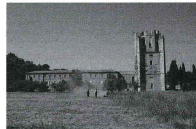
Abbaye de Lagrasse

J.B. : Oui il y a des modes, il y a des musiques qui ne sont que